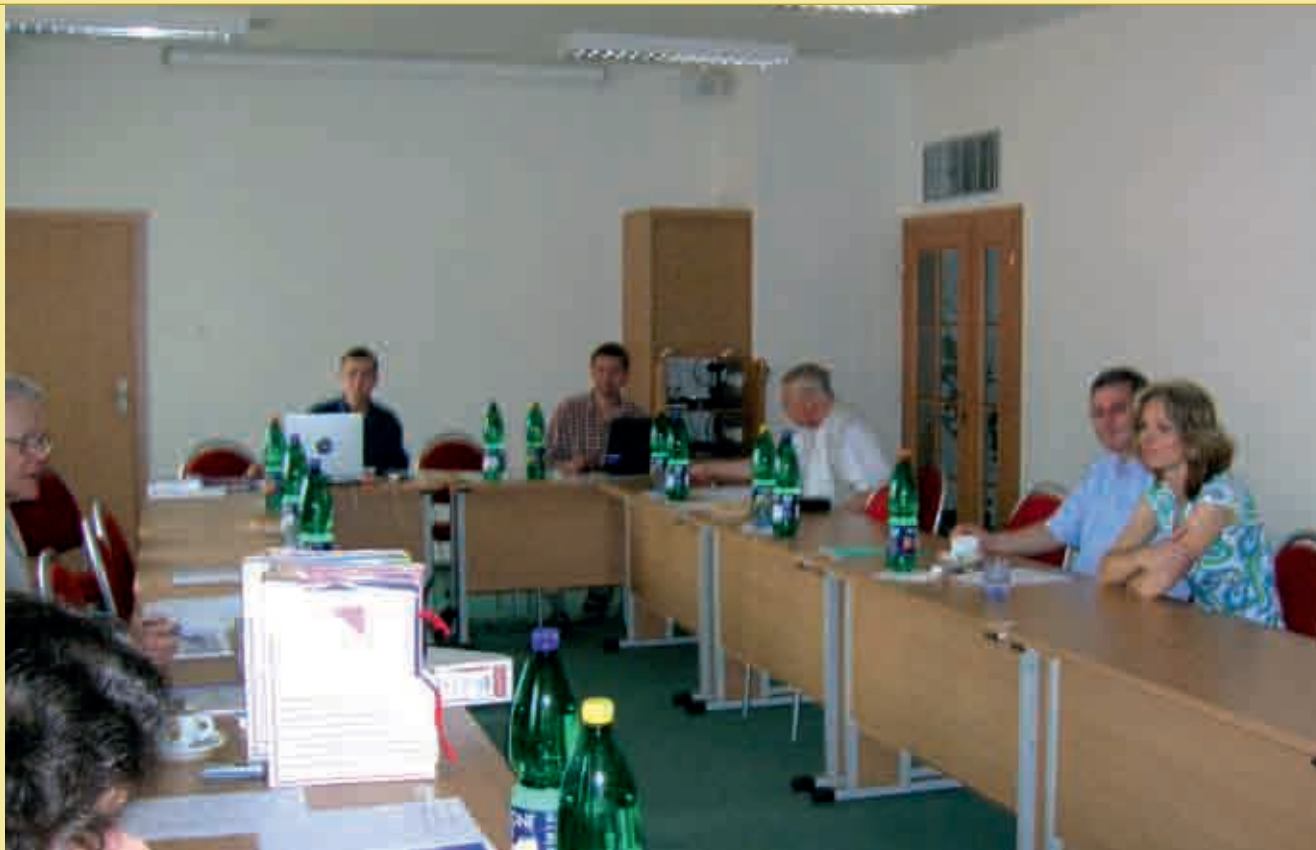
Zasedání výběrové komise