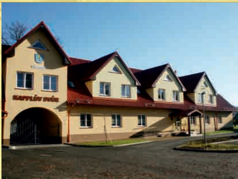
Sídlo MAS Pobeskydí